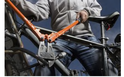
High Impact Crime